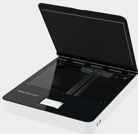
Kratzfeste Glasplatte ermöglicht das Scannen übergroßer Originale