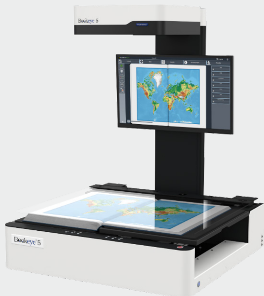
Der Bookeye®51 VA mit flacher Buchwippe und motorisierter Glasplatte

Vor dem Scannen senkt der Motor die Glasplatte auf das Buch, bis der gewünschte Druck erreicht ist. Der Druck wird hochpräzise gemessen und kann unter der Kontrolle des Benutzers bis zu 10 kg betragen. Sobald die Dicke des Buches in der Hubmechanik programmiert ist, muss der Scanner nur noch das Scanglas öffnen und schließen, um das Umlblättern der Buchseiten zu ermöglichen. Die Glasplatte öffnet sich nach jedem Scanvorgang automatisch im benutzerdefinierten Winkel. Die Geschwindigkeit, mit der sich die Glasplatte öffnet und schließt, ist ebenfalls individuell einstellbar.